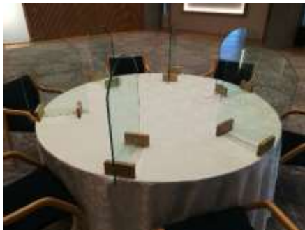
タイプ A (左右の面をカバー)