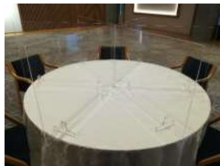
タイプ B (全面をカバー)