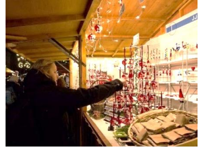
デンマークのクリスマスマーケット