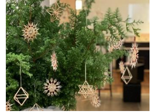
ヒンメリランカ様