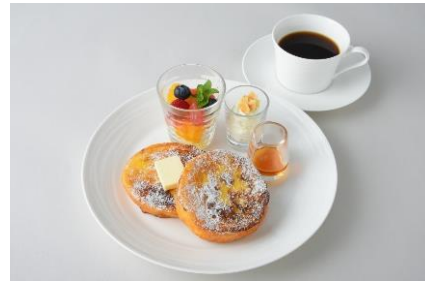
フレンチトースト ¥1,200 ※ドリンク付き