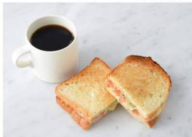
ハムとチーズのメルトサンド 単品 ¥660/ドリンクセット ¥891