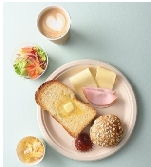
新メニュー 選べるパンとデリカテッセンのセット ※詳細は別紙メニュー表をご覧ください。