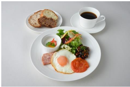
アンデルセンモーニングプレート ¥1,350 ※ブレッドバー・ドリンク付き