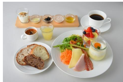
パンを楽しむごちそうプレート ¥2,475 ※ブレッドバー・ドリンク付き