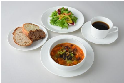
具たくさんミネストローネセット ¥1,350 ※ブレッドバー・サラダ・ドリンク付き