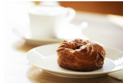
焼きたてのデニッシュペストリー 各種 (ダークチェリー ¥313/スパンダワー ¥270) ドリンクと一緒に楽しみいただけます。