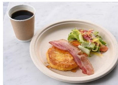
新メニュー フレンチトーストセット ¥968 (ドリンク付)